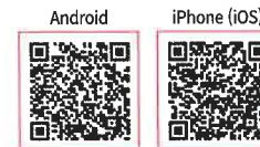
Электрон биллинг эришимли