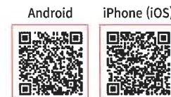
* Electronic billing