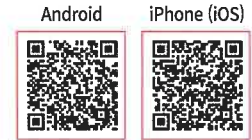
* Electronic billing

- Đăng ký chuyển khoản tự động để nộp tiền tiện lợi, đăng ký trước tài khoản nhận hoàn tiền để được chi trả nhanh chóng.