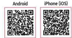
Э-нэхэмжлэл авах боломжтой